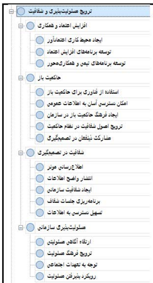
شکل ۵. راهکار ترویج مسئولیت‌پذیری و شفافیت

راهکار از تکنیک‌ها و راهکارهایی برخوردار است که به سازمان کمک می‌کند در مقابل چالش‌ها و تغییرات، انعطاف‌پذیر باشد و به بهترین نحو ممکن با مواقع مختلف سازگاری داشته باشد. در این راستا، یکی از جنبه‌های مهم این راهکار، ارتقاء توانمندی مدیران در مواجهه با تغییرات است. مدیران با برخورد با تحولات و تغییرات مختلف می‌توانند سازمان را به سمت جلب انطباق و افزایش کارایی هدایت کنند. همچنین، افزایش سطح آگاهی در مورد علل و پیامدهای تبعیض و ارتقاء دانش کارکنان نقش مهمی در پیشگیری و مدیریت تبعیض در سازمان ایفاء می‌کند. این راهکار همچنین به تسهیل ارتباطات سازمانی و ایجاد هماهنگی بین اعضای تیم می‌پردازد تا انطباق در سازمان بهبود یابد.