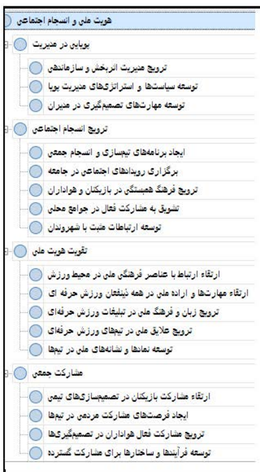
شکل ۳. راهکار هویت ملی و انسجام اجتماعی

به‌منظور مقابله با آپارتاید و تبعیض در باشگاه‌های ورزش حرفه‌ای ایران، راهکار هویت ملی و انسجام اجتماعی می‌تواند به‌عنوان یک نیروی محرک عمل کند. این راهکار با تأکید بر تعهد به ارتقاء ارزش‌های ملی و ایجاد یک حس انسجام در جامعه ورزش حرفه‌ای، به مدیران ورزشی کمک می‌کند تا تبعیض‌ها و نابرابری‌ها را کاهش داده و یک محیط پویا و برابر ایجاد می‌کند.