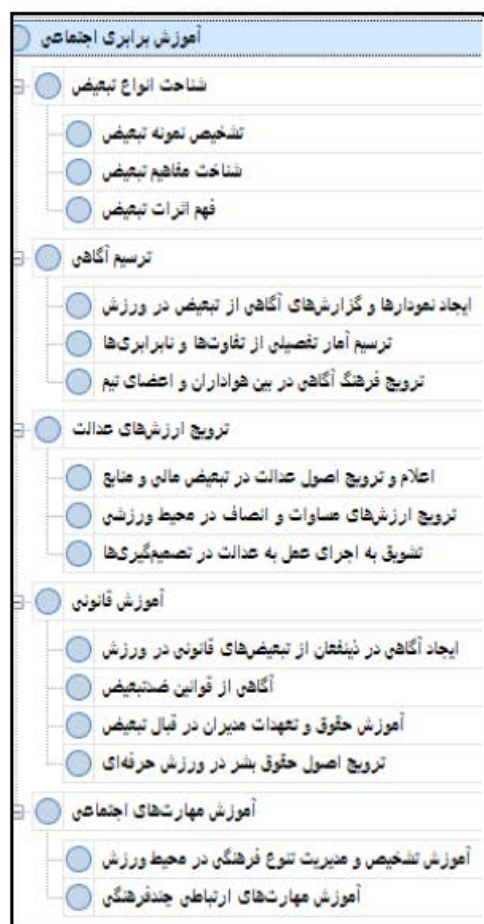
شکل ۴. راهکار آموزش برابری اجتماعی