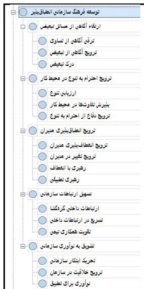
شکل ۴. راهکار توسعه فرهنگ سازمانی انطباق‌پذیر