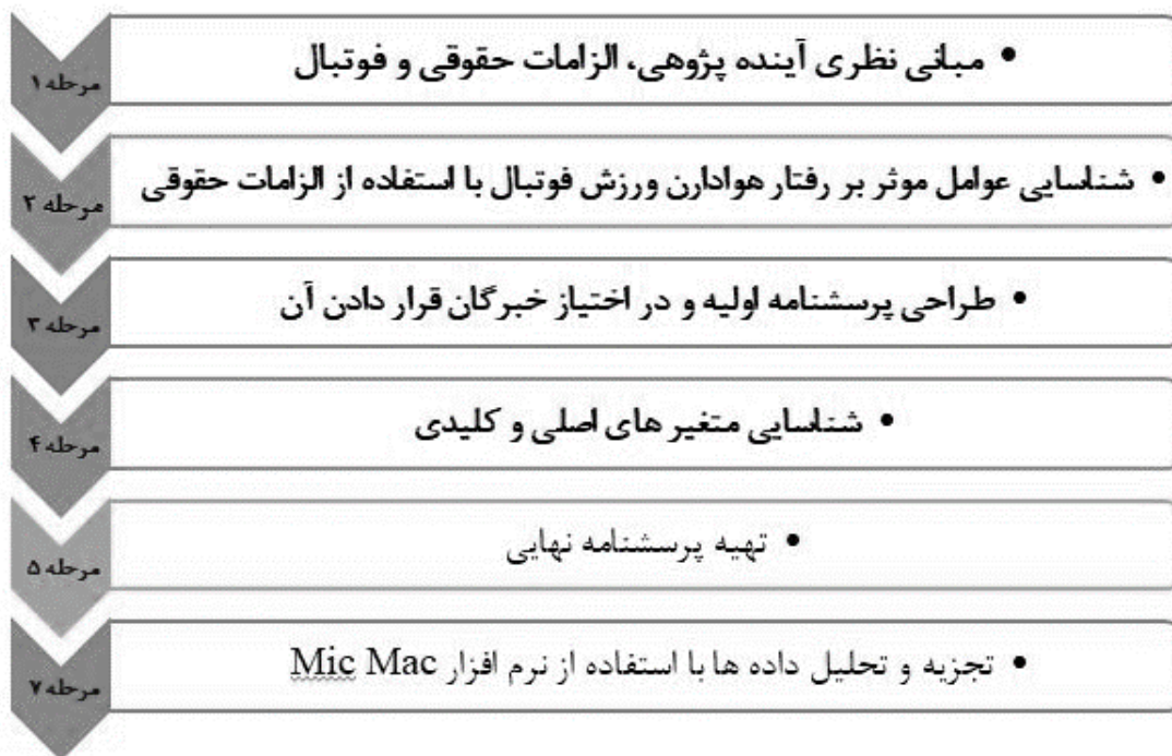
شکل ۱. مراحل انجام تحقیق

ها توسط خبرگان به روش دلفی، اجماع نظر نسبی نسبت به متغیرهای نهایی پژوهش حاصل خواهد که حاصل این اجماع نظر، متغیرهای اصلی هستند که شناسایی شده و در نهایت داده‌های کمی مورد استفاده در این پژوهش به صورت عددی و از طریق وزن دهی پرسشنامه‌های دلفی تهیه شد. پس از گردآوری شاخص‌ها و متغیرها، ماتریس تأثیر متقابل در دو مرحله تشکیل شده، به طوری که شاخص‌ها در سطرها